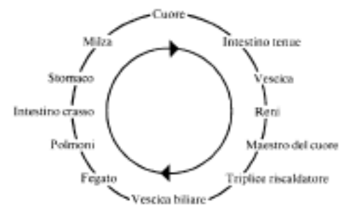
Immagine 5 il circolo dei meridiani

Quindi per gli atleti è quanto mai importante mettere a punto sempre di più tecniche mentali di regolazione e di gestione delle proprie emozioni per raggiungere sempre meglio il target e l'obiettivo della ripetitività e precisione del proprio gesto atletico e allenarsi tanto fisicamente nel potenziamento muscolare, che emozionalmente nel riconoscere, esprimere e verbalizzare le proprie emozioni.