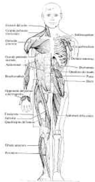
Immagine 4 I muscoli del corpo

*Laureata in Lettere, laureata in Psicologia dello Sviluppo e dell'Educazione, specializzata in Psicologia del Benessere, Kinesiologa professionista e Istruttrice riconosciuta dall'Associazione di Kinesiologia Specializzata Italiana secondo il Metodo Three in One Concepts - One Brain System©